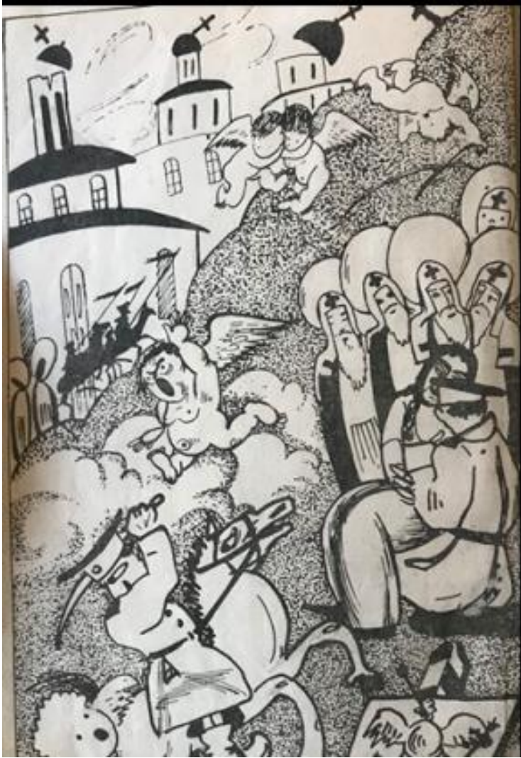
დემიან ბედნი „როგორ შევიდა მონაზონი სამოთხეში“, გადმოკეთებულია სილ. თოდრიას მიერ, თბილისი 1924.