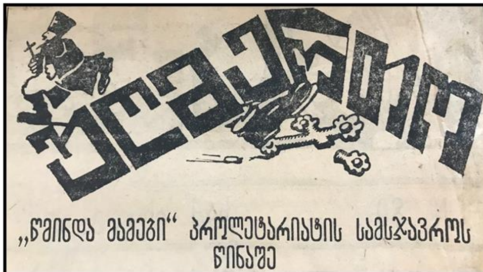
(გაზ. „სპარტაკი“, 1924, 23 მარტი, № 80)