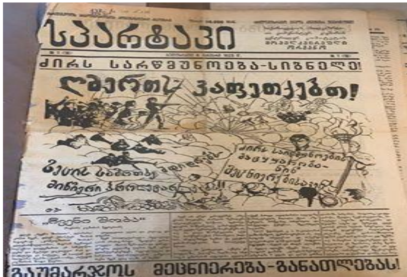
(გაზ. „სპარტაკი“ 1923, 4 იანვარი, № 1)