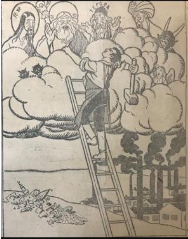
(გაზ. „მუშა“ 1923, 9 თებერვალი, № 66)