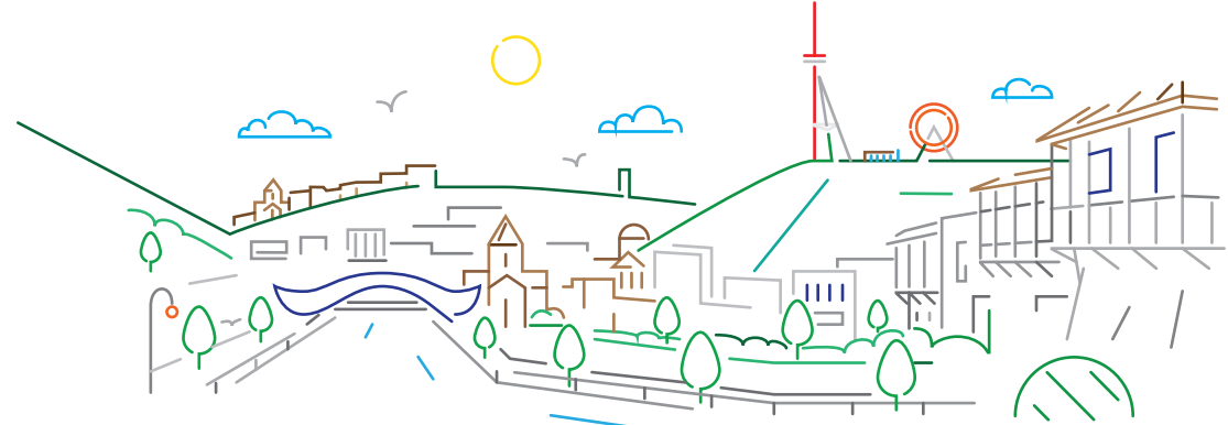
რატომ საერთაშორისო უნივერსიტეტი

საქართველოს უნივერსიტეტი გამორჩეულია უმაღლესი ხარისხის, მომთხოვნი საგანმანათლებლო პროცესითა და ისეთი ტიპის თანამედროვე ინფრასტრუქტურით, რომელშიც ადამიანი ხარისხიან განათლებასთან ერთად პრაქტიკულ უნარებსაც ეუფლება. სწორედ ამიტომ, საქართველოს უნივერსიტეტი ცნობილია, როგორც ერთ-ერთი ყველაზე პრესტიჟული უნივერსიტეტი, რომლის კურსდამთავრებული დასაქმების რეალური პერსპექტივით არის უზრუნველყოფილი. საქართველოს უნივერსიტეტის კურსდამთავრებულები ლაღად და მყარად გრძნობენ თავს კონკურენტულ გარემოში.